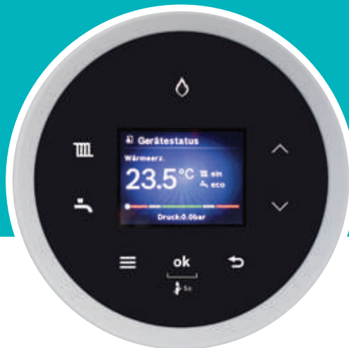
Дисплей HMI 700 Condens 5700i WT