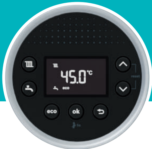
Дисплей HMI 300 Condens 5300i WT

И двата модела котли разполагат с LCD дисплеи. При котлите Condens 5700i WT това е цветен текстов и графичен дисплей. Независимо от модела на котела, директният и интуитивен достъп до основните настройки и информация е възможен с няколко лесни стъпки. Менюто и функционалността на контролните панели доставят лесно нужната информация на потребителя.